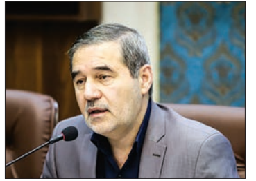
نامورمطلق: ایجاد پایگاه یونسکو منوط به پیگیری اصفهان است