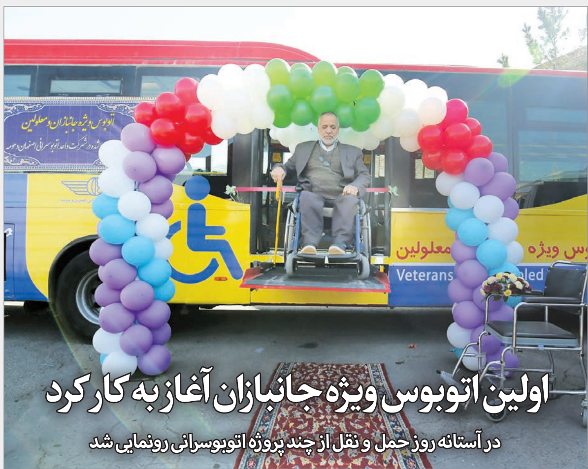
اولین اتوبوس ویژه جانبازان آغاز به کار کرد در آستانه روز حمل و نقل از چند پروژه اتوبوسرانی رونمایی شد