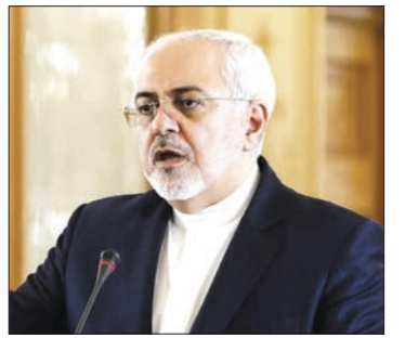
■ ظریف: این راهکار فقط به اروپا محدود نمی‌شود