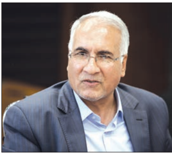
■ شهردار: پروژه‌های نیمه تمام زیادی از سال‌های گذشته مانده است