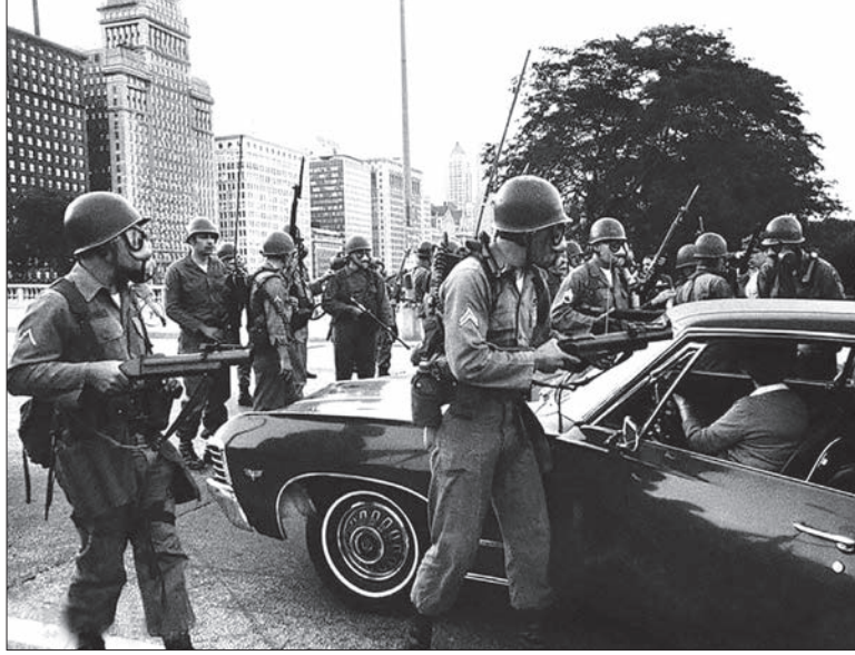
جنبش ضد جنگ با جذب اعضای از دانشگاه ها، حومه نشین ها از طبقه متوسط جامعه، اتحادیه های کارگری و نهادهای دولتی در سال ۱۹۶۵ اهمیت ملی یافت و در سال ۱۹۶۸ به اوج خود رسید و قدرت خود را در طول جنگ ویتنام حفظ کرد. این جنبش که حوزه های سیاسی، نژادی و فرهنگی را در بر می گرفت منجر به شکاف عمیقی در دهه ۶۰ در داخل جامعه آمریکا شد.