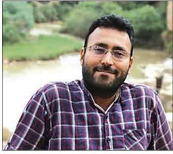
گفت و گو با عکاسی که حادثه تروریستی اهواز را شکار کرد

سکه های ۲۰۰ و ۵۰۰ تومانی روانه کوره می شوند