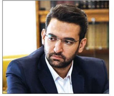
وزیر ارتباطات در اصفهان: مسئولان مسن از مسئولیت جدا شوند

اولین نمایشگاه تکنولوژی، نوآوری و استارتاپ ها برگزار شد