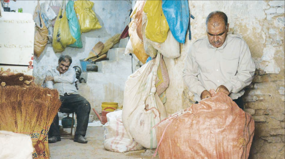
عکس از نقاشی هاشم منوچهری