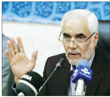
استاندار اصفهان: ۵۲ کیلومتر لوله‌گذاری صورت خواهد گرفت