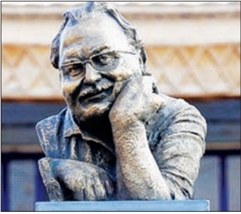
سردیس قوکاسیان در میدان جلفا پاینده آفتاب و مهتاب است