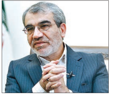
واکنش شورای نگهبان به اظهارات مطهری