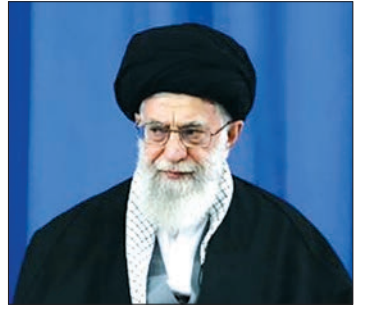
■ کار جهادی باید از مجاری قانونی انجام شود