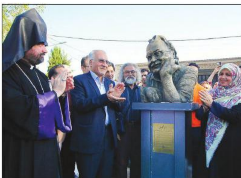
زاون در جلفا زنده شد. تیرتی که در روز بزرگ همه کانال‌های خبری نقش بست. اما حقیقت این است که زاون همیشه و همه جا در این چند سال زنده بود. در گوشه گوشه این شهر...