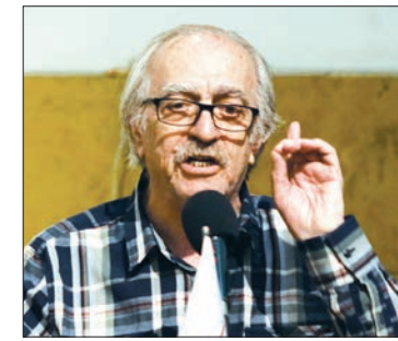
■ تجلیل از محمدعلی نجفی فیلمساز اصفهانی، در اصفهان