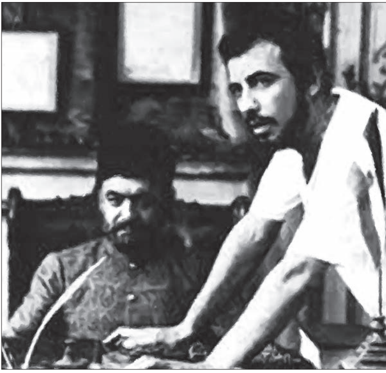
پیروزی محرومان قطعی است. دل نگرانی ما از خود خواهی آدمی است که می خواهد به چشم خود شاهد پیروزی باشد. پیروزی رؤیت خواهد شد، حتی اگر در کاسه چشم های من و تو گیاه رویده باشد. از فیلمنامه هزارستان علی حاتمی