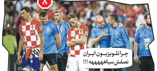
۴. چرا تلویزیون ایران نمکش سیاهههههه!!!