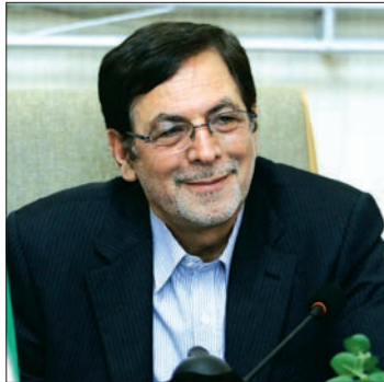
■ دولت برای جلوگیری از برداشت های بی رویه اقدامی نمی کند