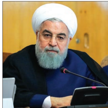
■ واعظ می گوید رئیس جمهور در حال بررسی اسامی مختلف است