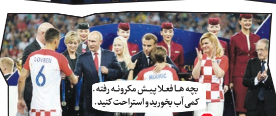
۵. بچه ها فعلا پیش مکرونه رفته. کمی آب بخورید و استراحت کنید.