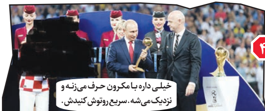
۲. خلیله داره با میکرون حرف می زنه و نزدیک می شه. سریع رونوش کنیدن.