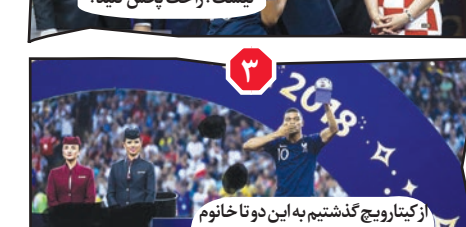
۹. ز کیتارویج گذشتیم به این دوتا خانوم گوشه سمت چپ و دوتا تماشاگر آقا بر خورد کردیم. سریع قوشاپ کنید.

۱۰. پی نوشت: از هر سو که حساب کنید ضرر به بیت المال است آقای حداد عادل.