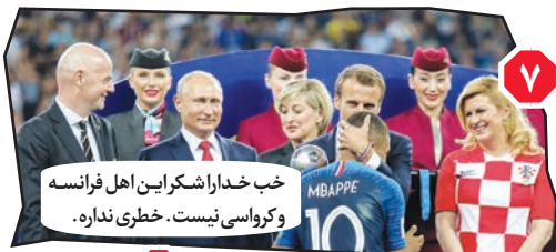
۱. خب خدا را شکر این اهل فرانسه و کراسوی نیست. خطری نداره.

علی مطهری، ضمن «مادرانه» خواندن در آغوش کشیدن بازیکنان توسط رئیس جمهوری کراسوی در مراسم فینال جام جهانی، از پخش این صحنه ها