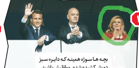
۳. بچه ها سوژه همینه که دایره سبز دورش کشیده شده. مواظبش باشید.