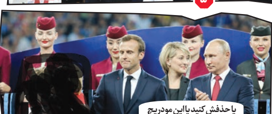
۸. یا حذفش کنید یا این مودریج پدر سوخته را قوشاپ کنید.