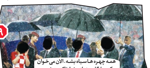
۷. همه چهره ها سیاه بنشه. الان می خوان عکس یادگاری بندهان خطناکه. به خصوص اون سد موبوره رابوشونید بامون بد می شه.