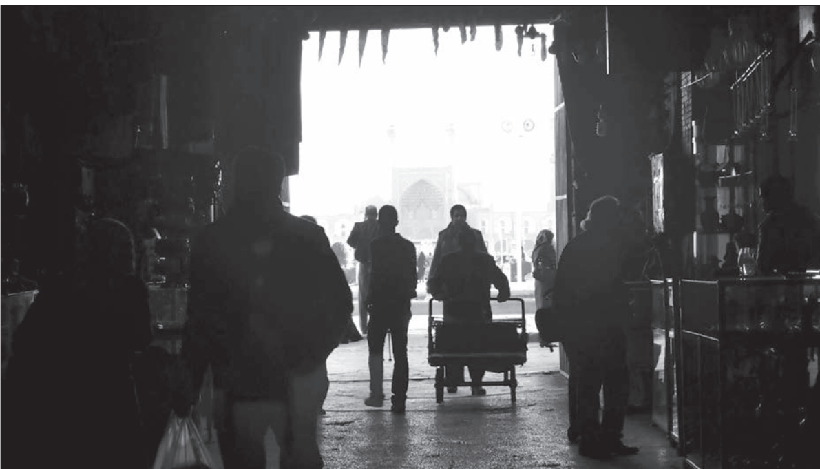
این نامه اخلاق حرفه ای اصفهان زیبا را در سایت روزنامه مطالعه کنید