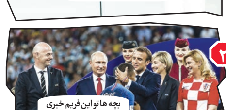
۶. بچه ها تو این فریم خبری نیست. راحت پخش کنید.