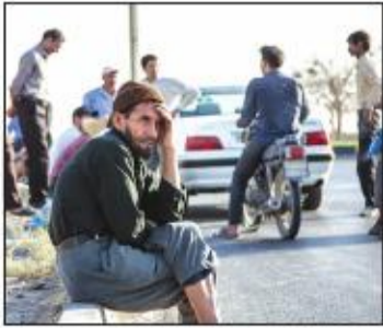
دسترسی به کارگران بدون حضور در خیابان ممکن می شود

مردم از ترس گرانی بیشتر خرید خود را افزایش داده اند