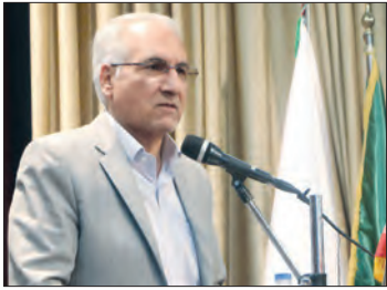
تعیین بحران های شهر و شهرداری برای نخبگان شورای هم اندیشی