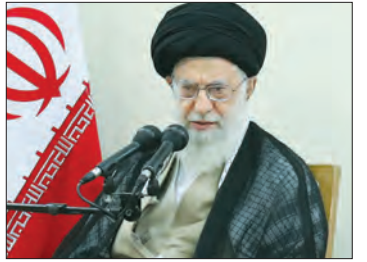
تقدیر رهبر انقلاب اسلامی از موضع رئیس جمهور در اروپا و دستور اقتصادی او

علی اکبر کجیاف: این دانشمند مبتکر پیوند واقعیت و آرمان است