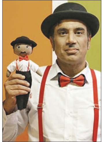
رادش و رادشک