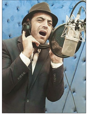
بگذارید موسیقی برای مردم بماند!