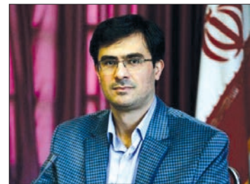
کدهای درآمدی و اعتباری در سال ۹۸ یکپارچه شد