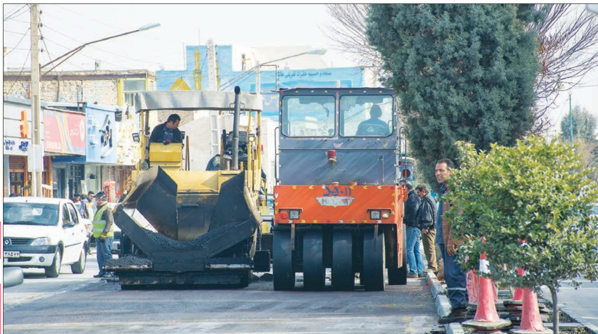
نقش از: طاهره صوری

پایش را آرام روی پدال گاز فشار داد و هم زمان کنترل فرمان را به دست گرفت. ماشین عظیم الجثه را در عرض خیابان و مماس با جرتقیل دیگری که در دست در موازات او پارک شده بود، پارک کرد و مثل قرقی از آن پیاده شد. به همکاران ایستاده و منتظر سلامی کرد و به سمت جرتقیل رفت. اول داخلش را نگاه کرد و به محض آنکه راننده را پشت فرمان دید، به طرفش حرکت کرد. در شاگرد را باز کرد و با صورتی که به بهنما می خندید، روبه راننده گفت: «خسته نباشی برادر! از اینا گنده تر نبود بدن به ما؟» و خودش غش غش خندید. شوخی اش اما خیلی به مذاق راننده خوش نیامد. لبخندی زد و گفت: «معلومه که تازه کاری!»، بعد ترمز دستی را کشید، پاکت سیگارش را از روی داشبورد برداشت و بی تفاوت از ماشین پیاده شد.