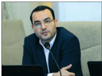
نمایشگاه صنعت سینما سینماگران اصفهان را حفظ می کند