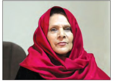
قاضی و وکیل زن اصفهانی از تفاوت های این دو منصب می گوید