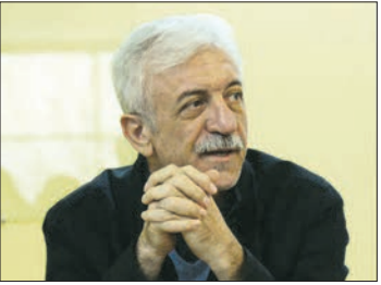
■ نورانی: گفت و گوی بین نسلی در تاریخ شفاهی توسعه می یابد