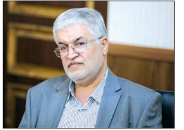
■ ائمه جمعه سایر استان ها به متجاوزان آبی تذکر دهند

■ تخریب اموال، دغدغه دائمی مدیران شهری است