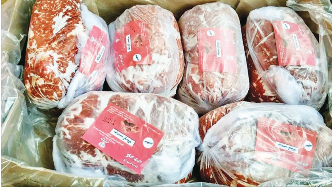
مدیرعامل شرکت پارس پتروشیمی

فروش اینترنتی گوشت، مرغ و تخم مرغ دولتی به زودی آغاز می‌شود