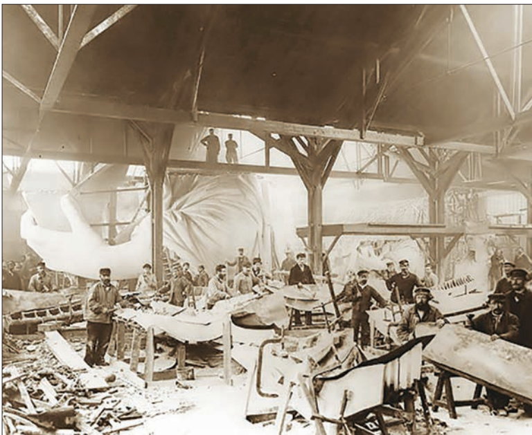
یکی از نکات بسیار مهمی که در رابطه با این عکس وجود دارد این است که مجسمه آزادی در پارک ساخته شده و اینکه چنین مجسمه بزرگی چطور به آمریکا منتقل شده نکته جالب و عجیبی به نظر می‌رسد.