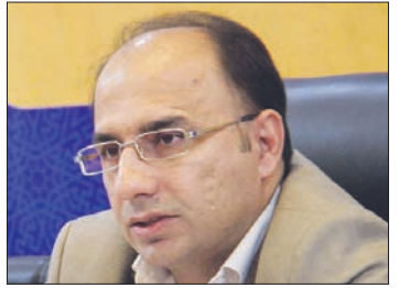
■ مناطق پانزده گانه شهرداری موظف به جلب درآمد پایدار شدند