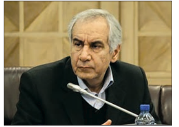
بخش عمده مشکلات ناشی از تحریم های داخلی است

واکنش ارشاد به حاشیه های واسپاری اکران فیلم های فجر