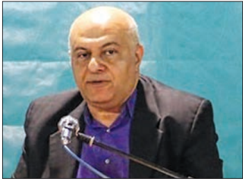
مازیار اولیایی: جنگ جهانی به ادبیات آمریکایی رونق داد

گزارش تصویری ۱۴ عکس از ۱۴ آرکس عکس اصفهان زیبا ۴