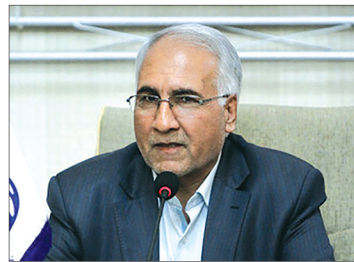
■ درصد عضویت در شبکه شهرهای دوستدار سالمند هستیم