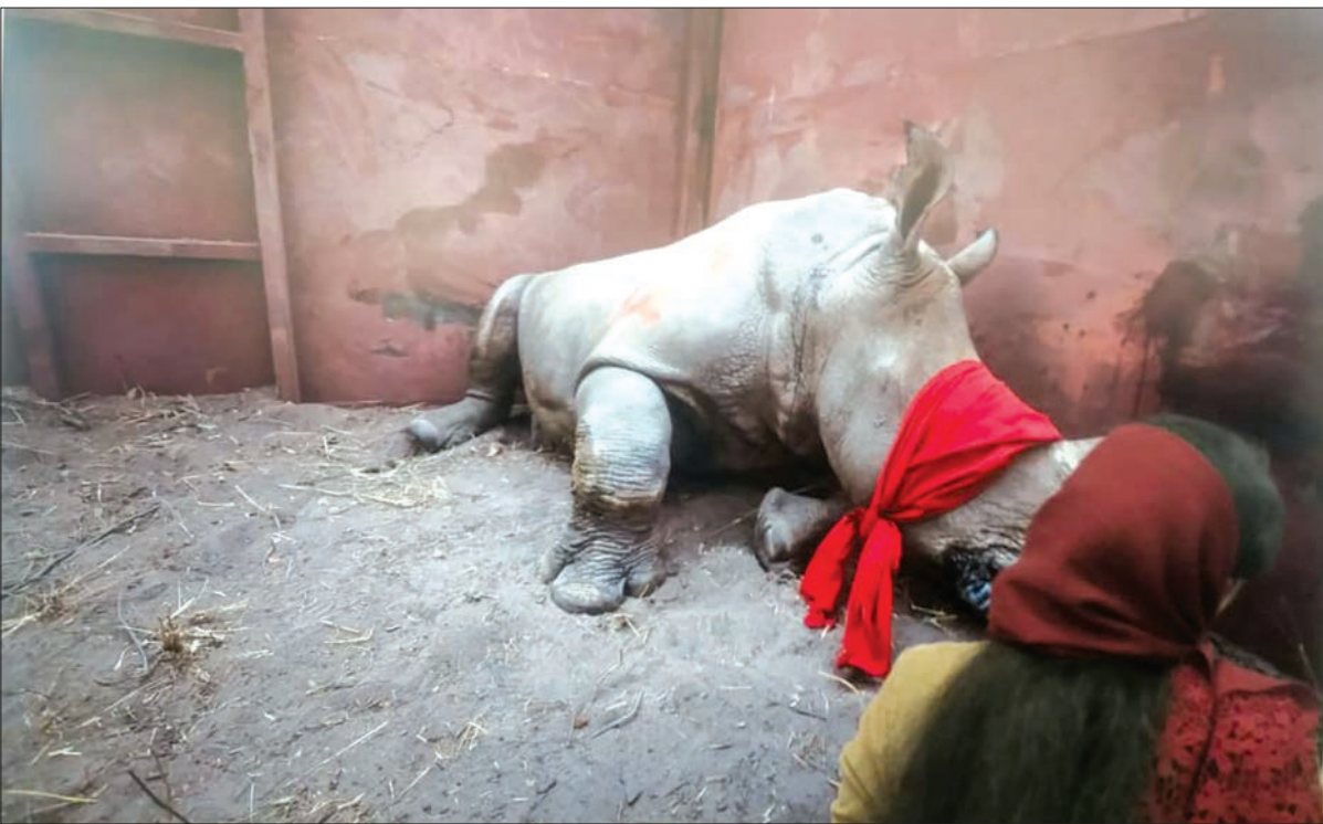
سرسرخ گرگدن مرده

تصاویر منتخب ۵۲ عکاس جهان خودنمایی می‌کند