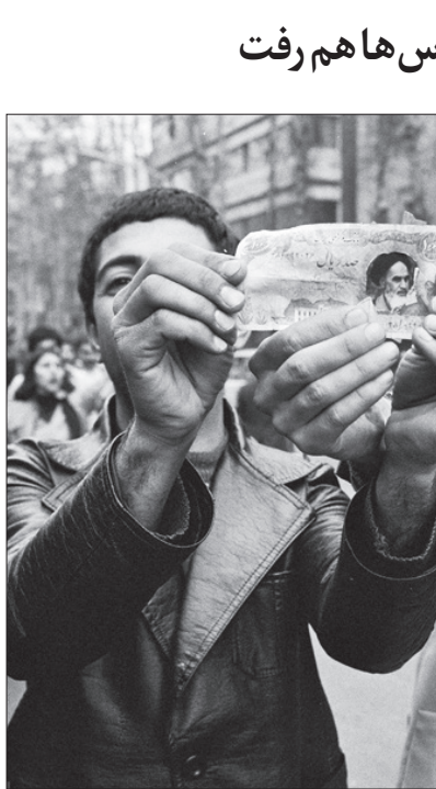
شاه‌های وصف نشدنی مردم از فرار شاه دردی ماه ۱۳۵۷؛ در حرکتی نمادین، جوانی تصویر پهلوی را بر اسکناس قرار داده است.