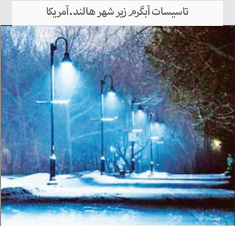
تاسیسات آبگرم زیر شهر هلند، آمریکا