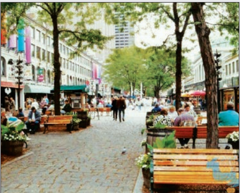
پیاده راه، بوستون آمریکا

اگر همت شود تا عید صندوق ۱۰میلیاردتومانی سرمایه‌گذاری خطرپذیر در اصفهان راه‌اندازی می‌شود