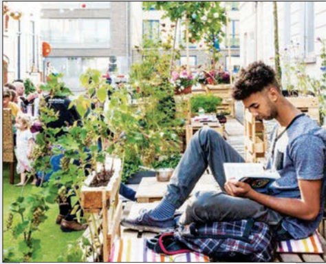
مبلمان شهری، هلند