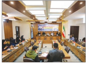
آسیب های اجتماعی مدارس در میزگرد ایمنابرسی شد