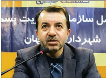
علی دهنوی: تکنولوژی بازیافت به روز می شود