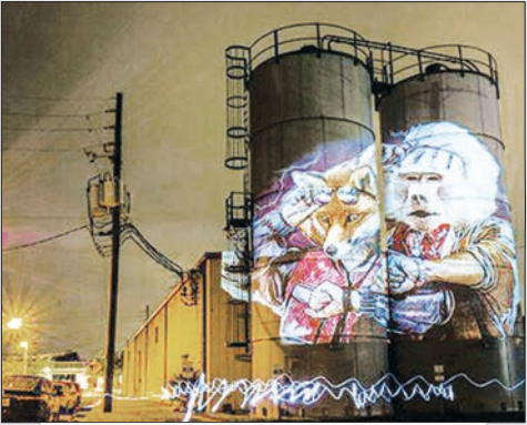
گردشگری شبانه و نورپردازی، اوهاو