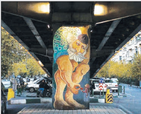
منظر شهری + تهران