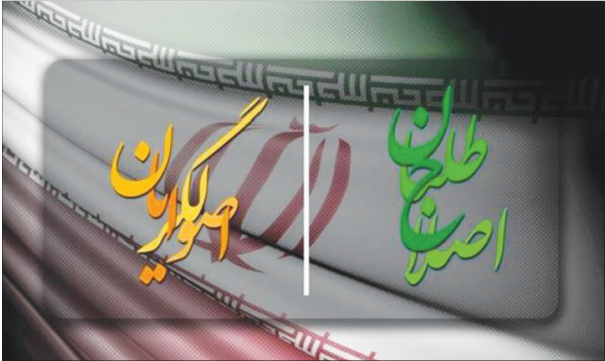
«پایان ماجرای اصلاح‌طلبی و اصولگرایان از راه رسیده است؟» این سوالی است که بعد از اعتراضات دی‌ماه ۹۶ نقل محافل سیاسی شد. موضوعی که نقطه آغازش به شعارها در اعتراضات سال قبل برمی‌گردد، اما تنها به اینجا ختمر نشد و کم‌کم برخی سیاسیون نیز از نقطه پایان برای جریان راست و چپ سخن گفتند.