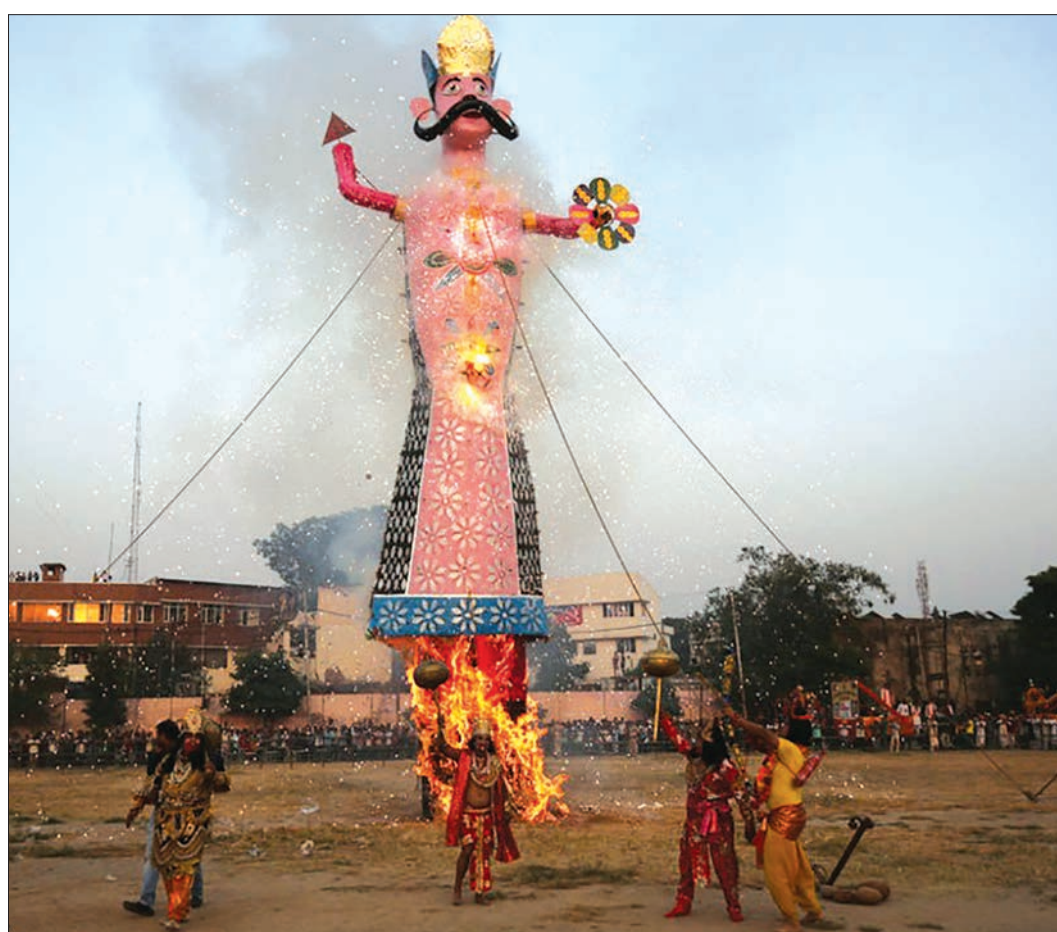
جشنواره مذهبی دوگکا بوجا در هند