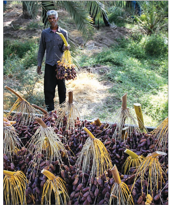
برداشت خرمای پیارم در هرمزگان - خبرگزاری مهر