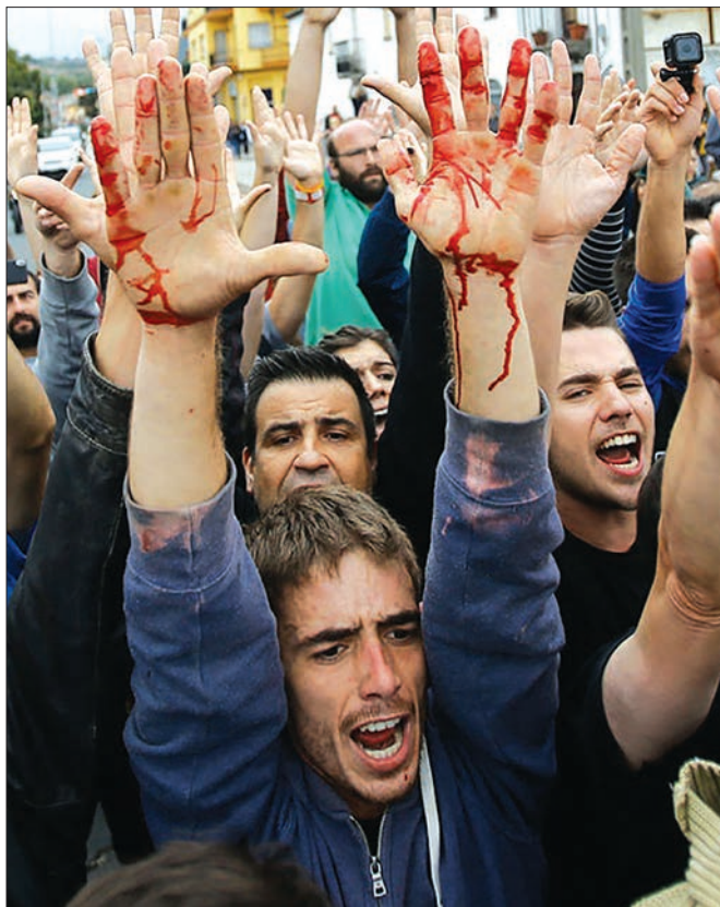
برخورد خشونت بار پلیس اسپانیا با جدایی طلبان