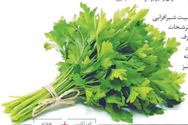
اورژانس + هفته

برای بانوان هم علاوه بر خاصیت شیرافزایی که برای مادران شیرده دارد، ترشحات و عفونت‌های بانوان را نیز برطرف می‌کند. البته خانم‌های باردار در مصرف آن باید احتیاط داشته باشند. استعمال موضعی آن نیز بر روی صورت، برطرف‌کننده زخم‌ها و جوش‌های صورت برای اطلاعات بیشتر در این