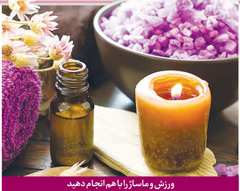
ورزش و ماساژ را با هم انجام دهید

ماساژ استرداد، دفع‌کننده مواد زائد بدن برای انجام این ماساژ پس از انجام ورزش بهتر است شخص در یک محیط گرم و مرطوب مثل گرمابه یا استخر و سونا قرار گیرد و آب نیم گرم (ولرم) بر روی بدن ریخته شود و