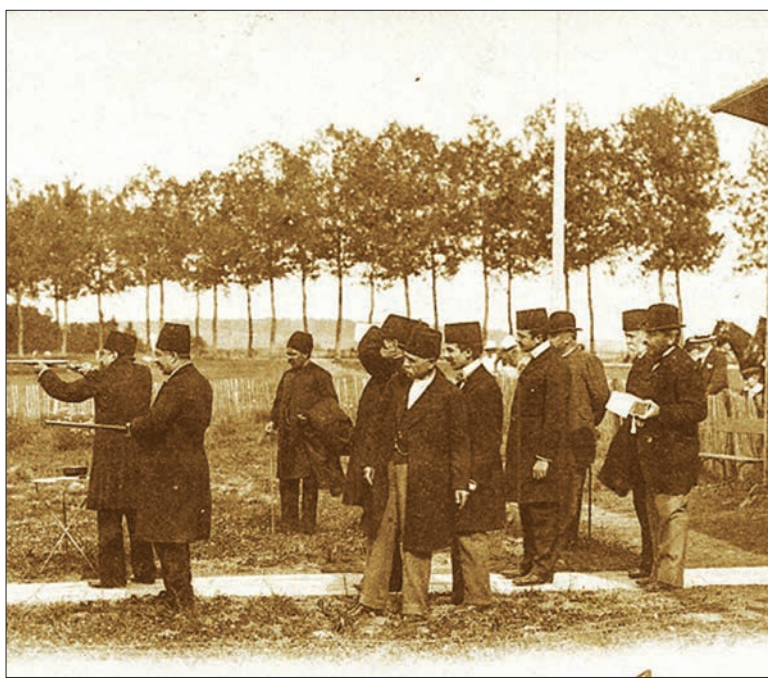
کارت پستال سرفراش قاجار-تصویر، کارت پستالی از دومین سفر مظفرالدین شاه به اروپاست. فرانسه که یکی از پیشگامان چاپ کارت پستال به شمار می رود، به افتخار سفر شاه قاجار به این کشور صحنه شکار او را بر روی کارت