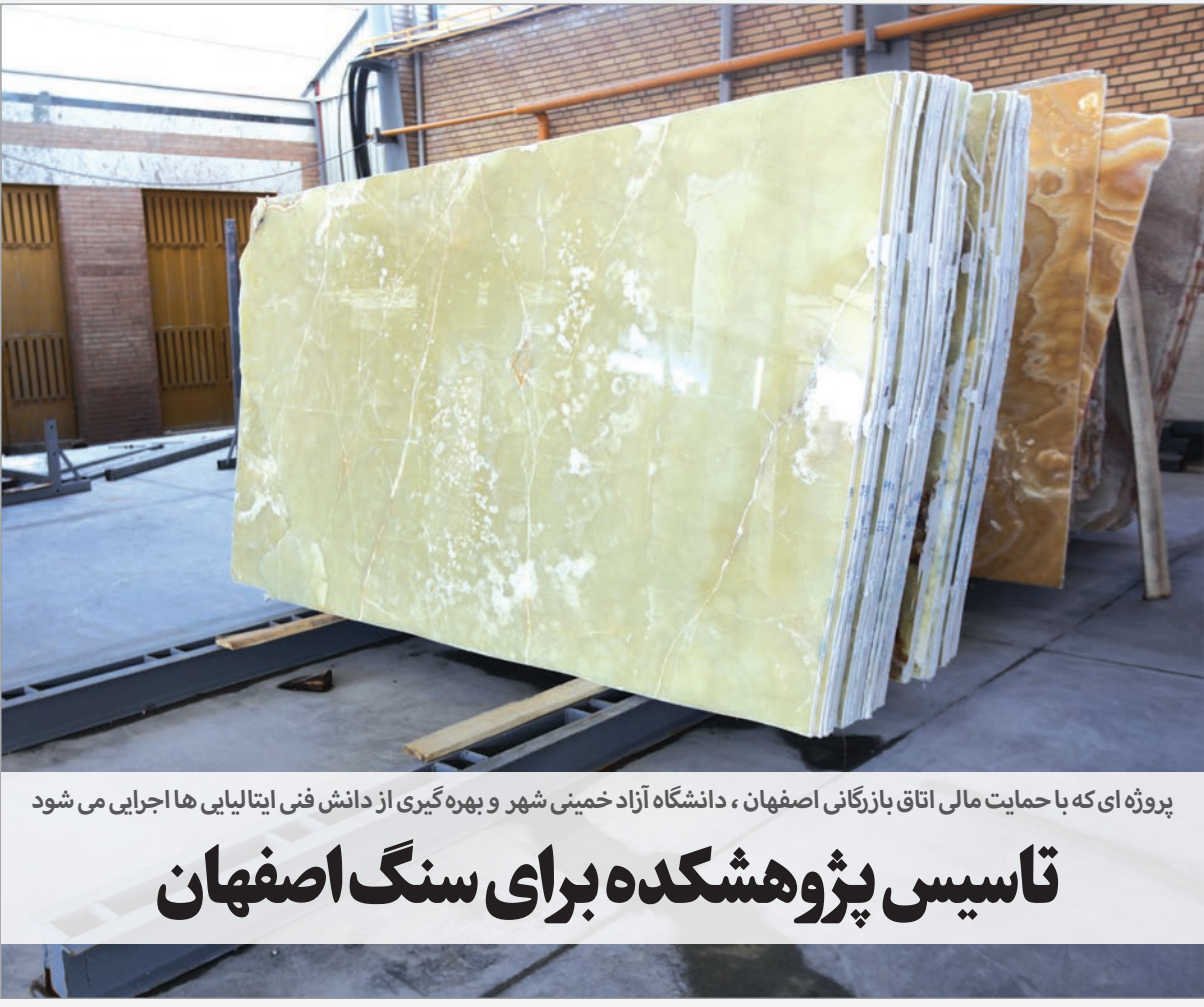
پروژه‌ای که با حمایت مالی اتاق بازرگانی اصفهان، دانشگاه آزاد خمینی شهر و بهره‌گیری از دانش فنی ایتالیایی‌ها اجرایی می‌شود