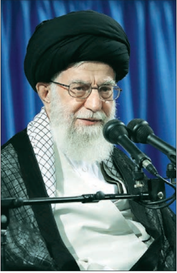
کوتاه از سیاست

ممتاز فریضه حج را ظرفیتی بی نظیر اجتماعی «آن برشمردند و تاکید کردند؛ حج مظهر «عظمت، وحدت و یکپارچگی و قدرت امت اسلامی» است که با اعمال و شرایط خاص، هر سال بی وقفه، در یک نقطه معین، انجام می شود. ایشان، آشنایی حجاج از ملیت های مختلف با یکدیگر و نزدیکی دل ها و دراز شدن دست کمک و یاری را از جمله جنبه های درونی و اجتماعی حج دانستند و خاطرنشان کردند؛ حج با تمام این ویژگی های منحصر به فرد معنوی و اجتماعی، بهترین زمان و مکان برای اعلام مواضع امت اسلامی در خصوص مسائل مهم جهان اسلام است. رهبر انقلاب اسلامی، موضوع «برائت از مشرکان» را که همواره مورد تاکید امام بزرگوار (ره) بود، فرصتی برای اعلام مواضع در موضوعات مورد قبول امت اسلامی خواندند و افزودند؛ یکی از این موضوعات، قضیه مسجدا لاقصی و قدس است که این روزها