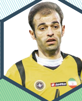
محرم نویدکیا (خدا حافظی از فوتبال)

پرافتخارترین بازیکن تاریخ لیگ برتر، تمام قهرمانی‌هایش را با سپاهان جشن گرفته است. کاپیتان محرم در لیگ‌های دوم، نهم، دهم، یازدهم و چهاردهم با سپاهان به قهرمانی لیگ برتر رسید و چهار بار نیز در جام حذفی جام را بالای سر برد. وی با خدا حافظی از فوتبال، رکوردهایش را هم به حافظه تاریخی فوتبال ایران سپرد.