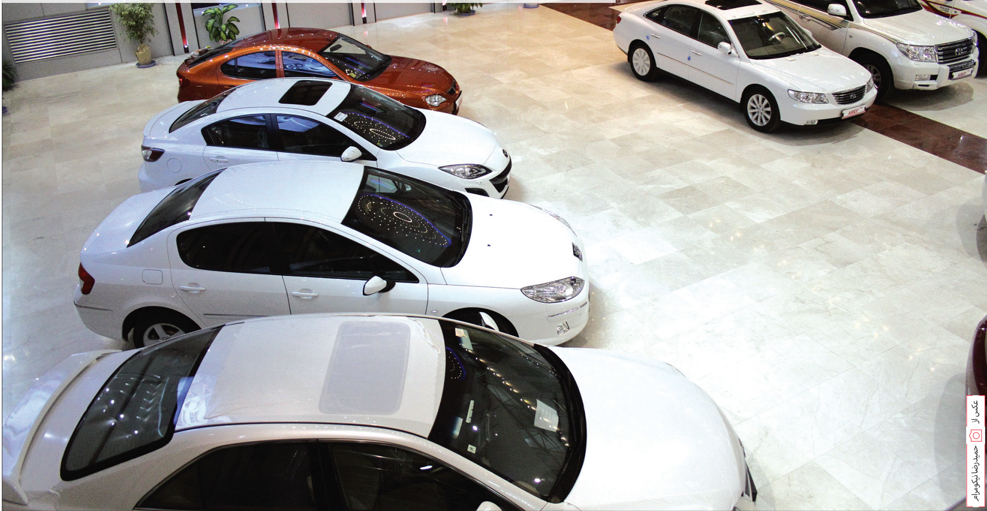
تصویر از: حمیدرضا انوشیروانی

چرا قهرمان شنا می خواهد با سلطان دریا مسابقه بدهد؟