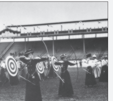
مسابقات المپیک تابستانی، ۱۹۰۸ لندن، مسابقات تیراندازی بانوان