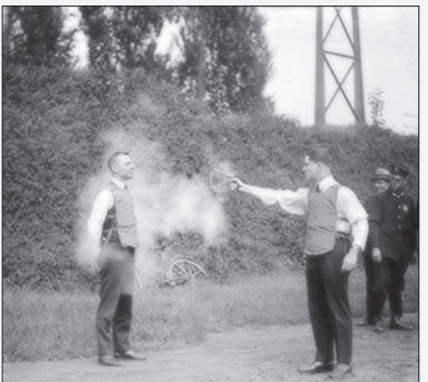
اولین آزمایش جلیقه ضد گلوله مرد شجاع داوطلب این آزمایش بر خطر