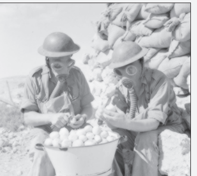
سربازان با پوشیدن ماسک در حال پوست کندن پیاز، ۱۹۴۱ میلادی