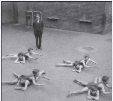
آموزش شنا در یکی از مدارس، ۱۹۲۰ میلادی

توپ های koosh: «اسکات استیلینگر» مخترع این اسباب بازی بود. او می‌خواست چیزی اختراع کند که بچه‌ها راحت با آن بازی کنند. سرانجام به راه حل جالبی رسید. نخ‌های لاستیکی قابل انعطافی که حول محوریک هسته لاستیکی نرم پیچیده شده بودند. در سال ۱۹۸۸ میلادی توپ‌های کوش بازار اسباب بازی جهان را تسخیر کرد و میلیون‌ها دلار ثروت برای سازنده‌اش به بار آورد.