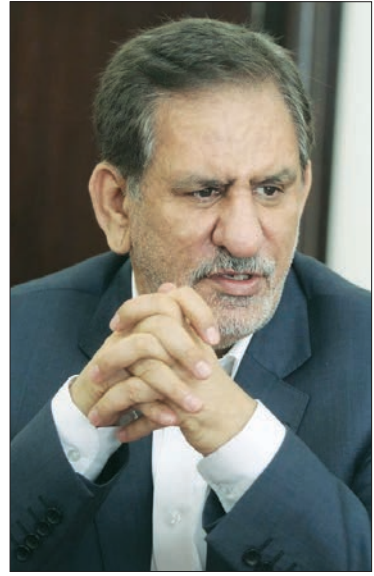
کوتاه از + سیاست