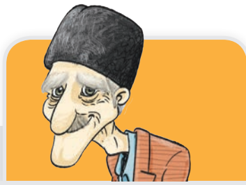
گوشت کوچا بوده س که تیش باشد