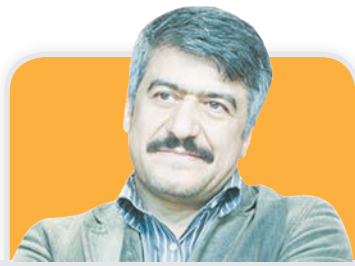
ترفندهایی که فقط جلیل سامان بلدست

جلیل سامان، کارگردان سریال «نفس» که با آغاز ماه مبارک رمضان از شبکه سه سیما پخش شد، در کانال تلگرامی اش پستی منتشر کرد و در مورد بعضی فرضیه‌ها توضیحاتی داد.