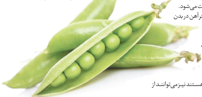
بهداشت + تغذیه

نخود فرنگی پخته شده به همراه عسل استفاده کنند. ضمناً نخود فرنگی به مادران باردار و شیرده توصیه می شود؛ اما مصرف بیش از حد آن سرگیجه به همراه دارد.