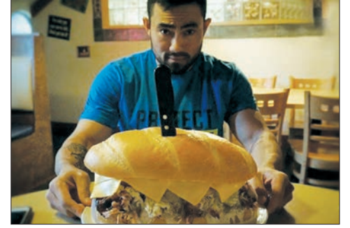
چالش خوردن ۱۵ هزار کالری

در این ایامی که واژه‌های مورد استفاده از جانب بعضی از رجال سیاسی جنجالی شده است، فکر کردیم مامم از واژه‌های جنجالی اصفهانی استفاده کنیم. تلاش برای پیدا کردن یک واژه از بین فرهنگ لغت پیرا اصفهانی‌ها به بن بست رسید. خیلی از واژه‌ها قابلیت استفاده نداشتند، بعضی دیگر هم بیش از حد جنجالی بودند. با این حال قورتنی را انتخاب کردیم. درباره این واژه قدیمی‌هایی گویند؛ یکی که خیلی ادعاش میشد جلدی جو می‌گیردش، می‌گن طرف قورتنیه س، مثلاً تویه مجلسی آدمانیشن، یکی وخمیسد می‌گد من همه این جمع‌برویون میدم، بقیه م می‌گن پدر... هر کی ندد، این حرفا که اونامی زنن، این‌اگه ناشی باید سری قورت میوفتدا بریونامی سوند.