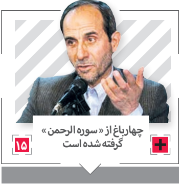
چهارباغ از «سوره الرحمن» گرفته شده است