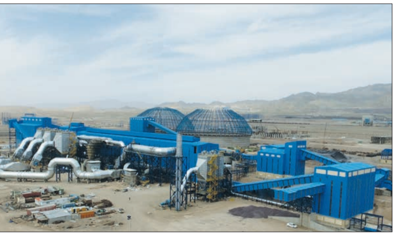
مدیرعامل گروه فولاد مبارکه خبر داد:

گندله یعنی گلوله های تولید شده از نرمة سنگ آهن و سایر مواد افزودنی که نخست خام و سپس پخته شده و سخت می شود و برای احیا به روش سنتی تولید آهن در کوره بلند از اقدامات مناسب دولت یازدهم به شمار می رود به گونه ای که در سال جاری نیز عملیات اجرایی چندین واحد تولید گندله آغاز شده و با بهره برداری از واحدهای گندله سازی سنگان و به وسیله شرکت فولاد مبارکه اصفهان نیز پنج میلیون تن به ظرفیت تولید گندله به منظور تامین خوراک تولیدکنندگان فولاد افزوده خواهد شد. گندله سازی یکی از زنجیره های تولید فولاد در کشور است. سنگ آهن مهم ترین و معدن ترین ماده اولیه برای تولید گندله به حساب می آید و واحدهای گندله سازی حلقه سوم پس از استخراج سنگ آهن و تبدیل آن به کنسانتره به شمار می روند.