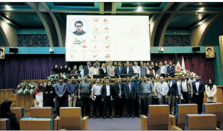
در دهمین رویداد در مسیر موفقیت اتاق بازرگانی مطرح شد:

با پایان یافتن عملیات نصب تجهیزات و تزریق گاز به خط لوله کارخانه گندله سازی پنج میلیون تنی فولاد مبارکه در منطقه معدنی سنگان، مشعل های این طرح عظیم صنعتی که نخستین و بزرگترین کارخانه گندله سازی شرق کشور است، روشن و مرحله راه اندازی گرم کارخانه آغاز شد. مدیرعامل گروه فولاد مبارکه در این خصوص تصریح کرد: کارخانه پنج میلیون تنی سنگان که با سرمایه گذاری فولاد مبارکه در این منطقه معدنی احداث شد، پس از طی مراحل ساخت و نصب تجهیزات اکنون با روشن شدن مشعل کوره گندله سازی به عنوان یکی از مهم ترین تامین کنندگان نیاز واحدهای فولادی کشور به گندله، آماده بهره برداری