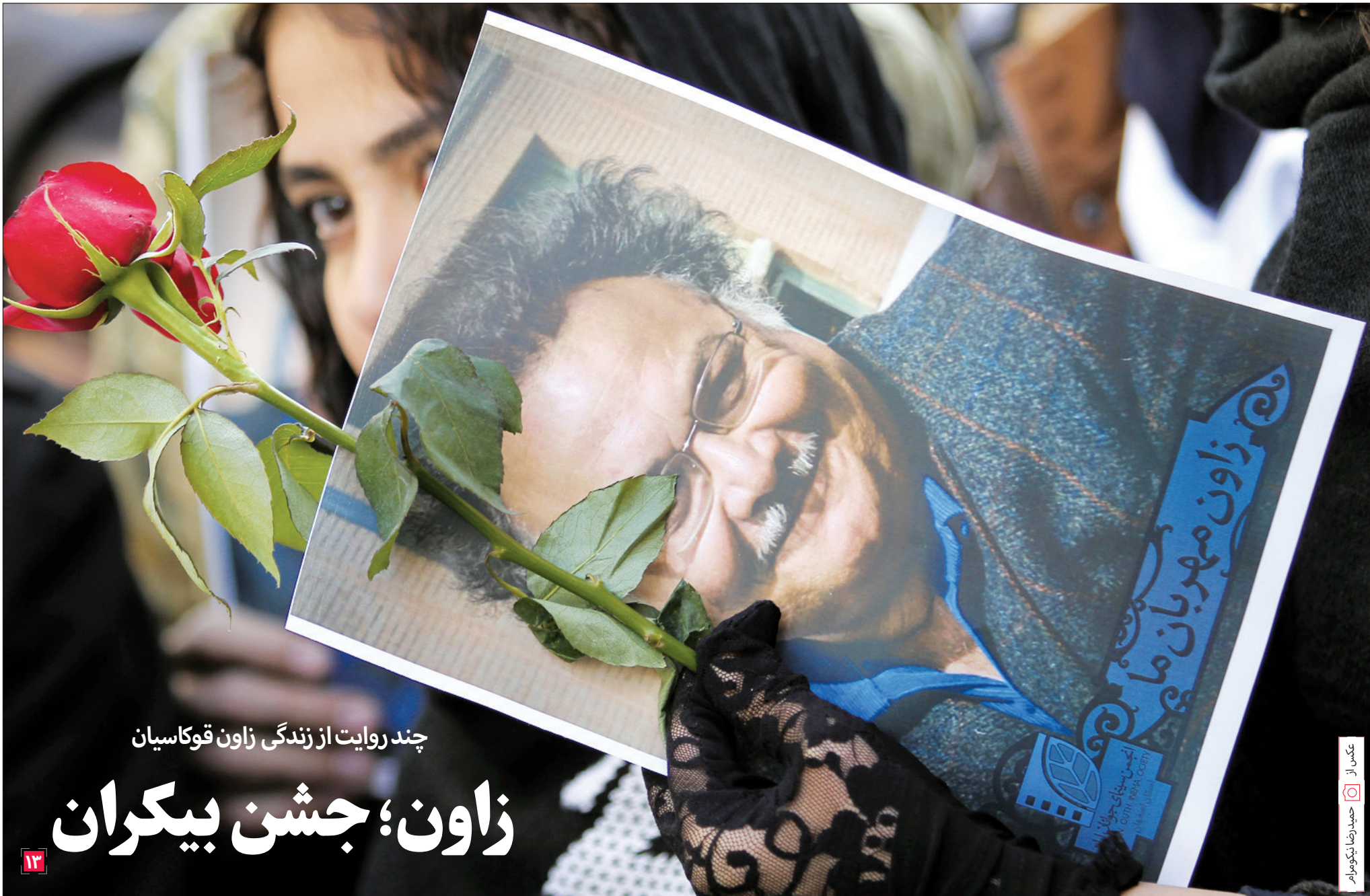
چند روایت از زندگی زاون قوکاسیان