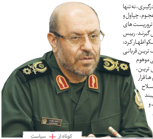
کوتاه از + سیاست

تاسف‌بارترین‌ها در صحنه این نزاع و درگیری، نه تنها از دولت و ملت‌های ستمدیده که مورد هجوم، چپاول و تخریب قرار دارند، دفاع نمی‌شود، بلکه ترویرست‌های مهاجم مورد حمایت و تشویق نیز قرار می‌گیرند. رییس هیات ایرانی در نشست بین‌المللی مسکو اظهار کرد: جمهوری اسلامی ایران که خود بزرگ‌ترین قربانی سلاح‌های شیمیایی بوده و در سایه اتهامی موهوم سالیان طولانی در معرض غیرانسانی‌ترین، غیرقانونی‌ترین، بی‌رحمانه‌ترین تحریم‌ها قرار داشته با هرگونه تولید، انباشت و کاربرد سلاح‌های شیمیایی مخالف است. به «برجام» پایبند خواهد بود، اما در مقابل هرنوع تهدید و تشرزدن آمریکا و کشورهای مرعوب نظام سلطه مقابله جدی خواهد کرد.