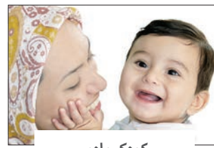
کودک مادر مادر کودک