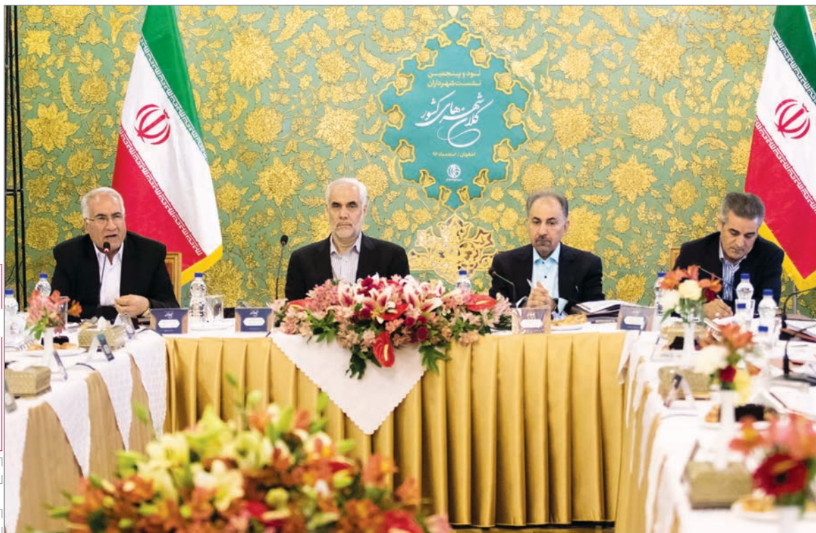
به همراه گزارشی تصویری

پیشنهاد شهردار اصفهان به بیانیه نشست بعدی کلان شهرها تبدیل شد