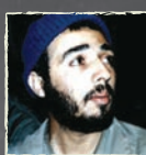
سردار شهید ابراهیم جعفرزاده

کسی نمی‌دانست که دیدار آخر است و نگاه‌های خدا حافظی. ابراهیم تقاضای قرآن کرد. آن را گوشود. چشمانش به آیه‌ای افتاد: «فاستقم كما أمرت». آیه را بلند خواند و رو به خانواده گفت: «این آیه فقط برای من نیست برای شما هم هست. باید استقامت کنید و در آزمایشات الهی با صبر و توکل به پیش روید.»