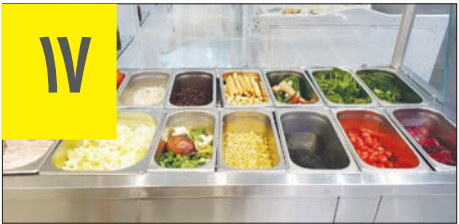
تعداد سالادهایی که عرضه می کند