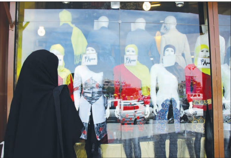
سعی در غفاری

فروشگاه های زیادی به بهانه تغییر فصل، اجناس خود را به حراج گذاشته اند که در میان آنها مارک فروشان سهم بالایی دارند. بررسی های میدانی نشان می دهد که بیش از ۵۰ درصد از حراج های هفته گذشته بازار اصفهان را فروشگاه های پوشاک مارک برگزار کرده اند. رستوران و کافی شاپ های اصفهان نیز به همراه مراکز بهداشتی، تخفیف هایی بر روی قیمت خدمات خود اعمال کردند، با این حال تعداد حراج های آنها در مقایسه با گذشته، به طرز چشمگیری کاهش پیدا کرده است. مراکز سرگرمی و آتلیه های شهر نیز همچنان جشنواره های فروش کمی بر پا می کنند؛ اما درصد تخفیف های خود را بیش از پیش افزایش داده اند. در ادامه به بررسی حراج های هفته قبل خواهیم پرداخت.