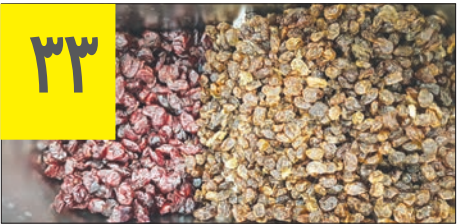
تعداد ماده های ترکیبی برای تولید سس