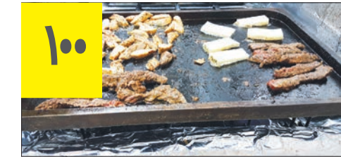
میلیون هزینه اولیه برای راه اندازی سالاد بار