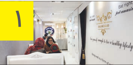
اولین سالاد بار در اصفهان

گفت و گو با زن کارآفرین اصفهانی درباره سالاد، سس و کسب و کار!