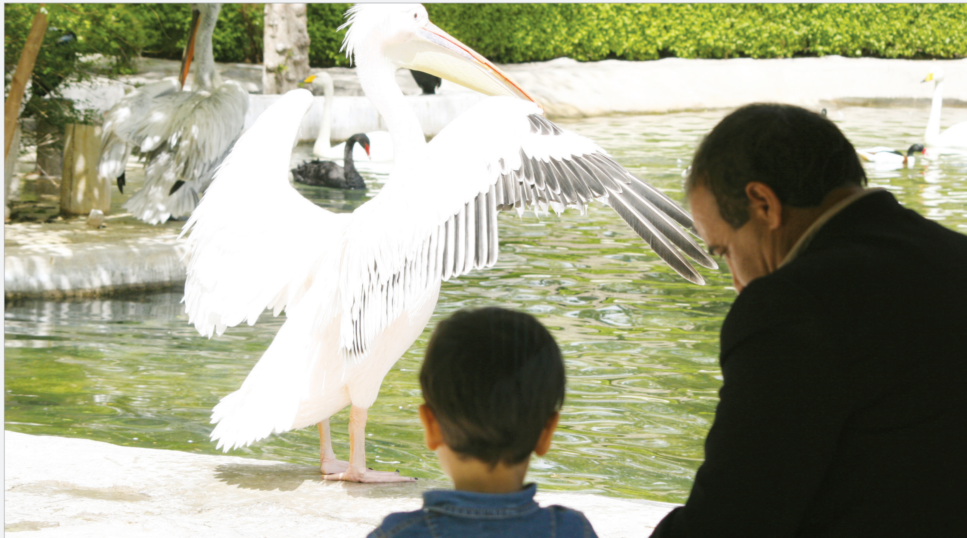
در ربه شهر طبیعت‌گردی کنید