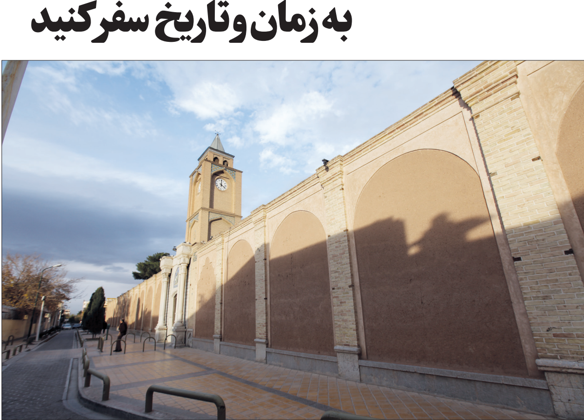
مسجد جامع اصفهان

با گذر در کوجه های پر پیچ و خم و تماشای خانه های قدیمی ؛ به زمان و تاریخ سفر کنید