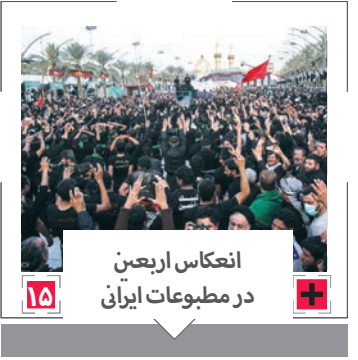
انعکاس اربعین در مطبوعات ایرانی