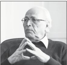
ضیاء موحد در نشست خبری

دلیل دارند. همچنین افرادی را در جلسات خود دعوت می‌کردند که افراد معتبری هستند. این کمی‌کار آسان و نوشته‌ها را یکدست و یکنواخت می‌کند.