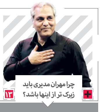
چرا مهران مدیری باید زیرک تر از اینها باشد؟