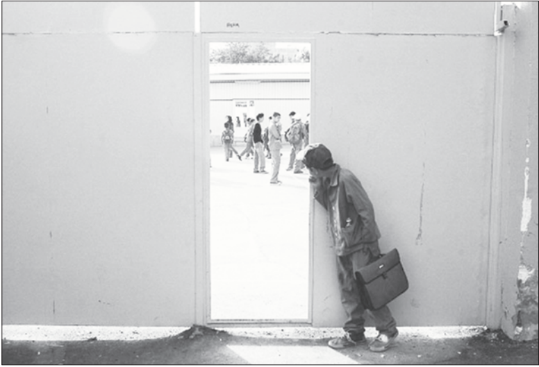
عباس خاتم نسیم

سرعت هواییا کم‌تر می‌شود؛ ارتفاعش هم، انگار به بی‌وزنی رسیده. می‌خزد روی باند فرود و آرام آرام متوقف می‌شود، پیاده می‌شوی، نگاهی به اطراف می‌اندازی و اولین چربه‌های غربت را با پلی‌س، جدای از مسائلی مثل «هوا به هوا شدن» و یا پدیده به قول خارجی‌ها «homesick» و نوستالژیا و همان غم غربت خودمان، یک مساله مهم دیگر کمرم و نرم‌نر خود را می‌نمایاند: من میان این همه غریبه چه کنم برای شغل و کار و گذران زندگی؟ افغان‌ها درصد زیادی از جامعه اتباع غیر ایرانی ما را تشکیل می‌دهند و به همین میزان سهم قابل توجهی در وضعیت اجتماعی و فرهنگی ایران دارند. شهروندان افغانی مقیم اصفهان برای فعالیت‌های هنری خود با مشکلاتی روبه‌رو هستند؛ اگر پاسخ آزی است، این مشکلات چیست و از کجا نشأت می‌گیرد؟