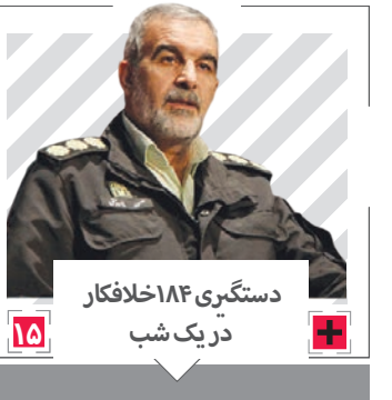
دستگیری ۱۸۴ خلاقکار در یک شب