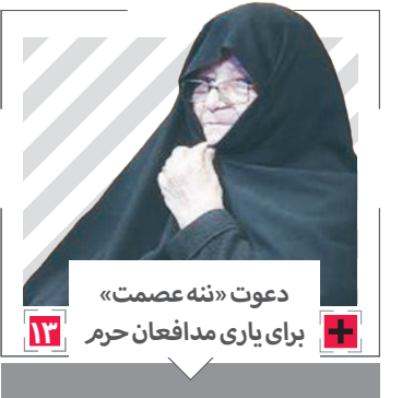
دعوت «ننه عصمت» برای یاری مدافعان حریم