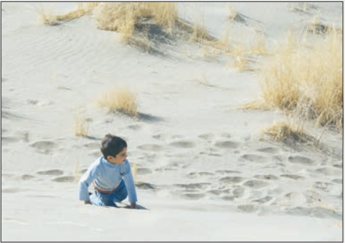
فکر بازی می‌کرد