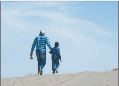
من صدای قدم خواهش را می‌شنوم