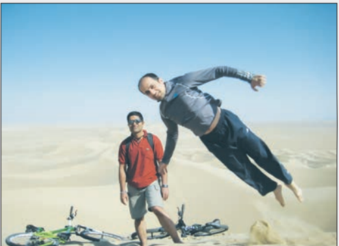
بگذاریم غریبه‌یی بازی برود