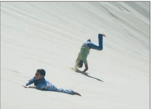
گویدم دل: هوس لبخندی است