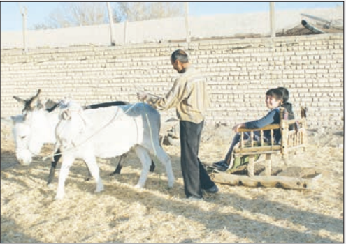
کجا نشان قدم ناتمام خواهد ماند