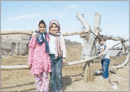
بال‌ها، سایه پرواز را گم کرده‌اند