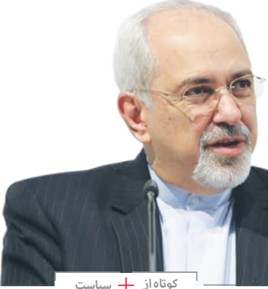
کوتاه از + سیاست

شد: به نظر من این به نفع آمریکا و بقیه طرف هاست که به این توافق بین المللی پایبند باشند و دلیل بیان این مساله این است که از نظر آمریکایی ها بهترین حالت این خواهد بود که بتوانند تحریم ها را به آنگونه که قبل از برجام داشتند، اعمال کنند. در صورتی هم که آمریکا این توانایی را داشته باشد که تحریم ها را اعمال کند چه چیزی عایدش خواهد شد؟ اگر آمریکا با اعمال تحریم ها می توانست اقتصاد ما را نابود کند چرا از همان ابتدا پای میز مذاکرات آمد؟ رییس دستگاه دیپلماسی کشورمان در پاسخ گفت: ما یاد گرفته ایم که چگونه امنیت خود را برپایه ای که مردم تضمین کنیم. اگر چه برای تعامل با دنیا آماده ایم اما اگر این رابطه قطع شود، نخواهیم مرد. ظریف در ادامه با اشاره به پیشرفت های ایران با وجود تحریم ها