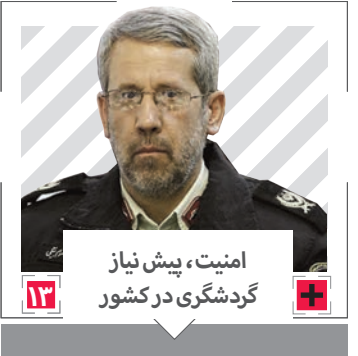
امینیت، پیش نیاز گردشگری در کشور