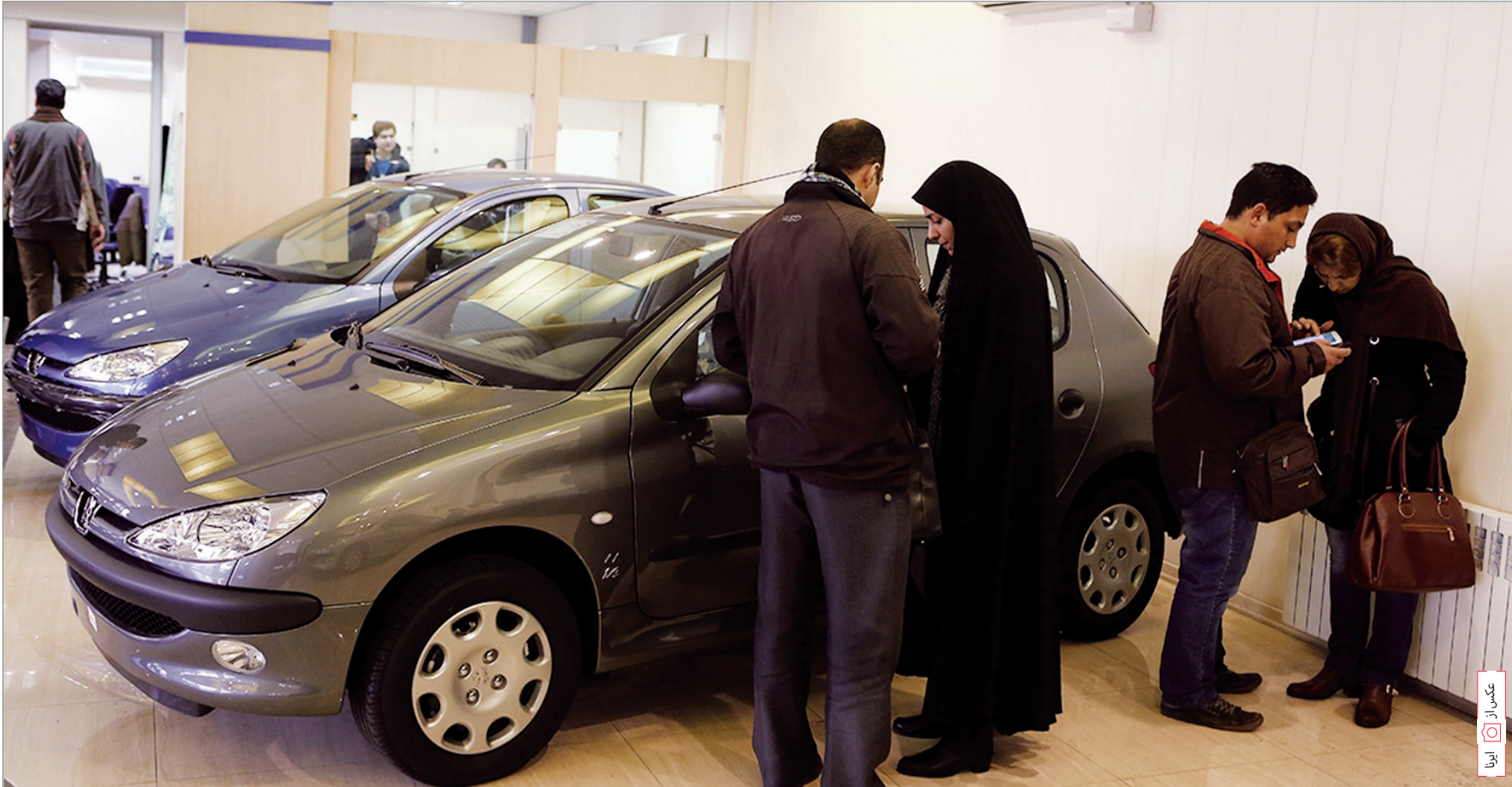
عکس از: ایرنا