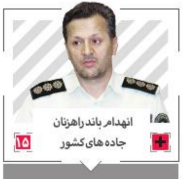
انهدام باندراهنزان جاده های کشور