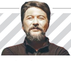
خشم، جامعه‌را فراگرفته است

نهم ربیع هر سال تجدید بیعت با امام مهربان است. نهم ربیع هر سال روز زنده نگه داشتن نهم است.» ماهنامه فرهنگی انتظار نوجوان به مدیریت مسوولی سید مسعود پورسیداقایی چاپ و روانه بازار شده است. گفتنی است؛ این شماره از ماهنامه با قیمت پنج هزار و ۷۰۰ تومان در دسترس علاقه‌مندان قرار گرفته است.📷