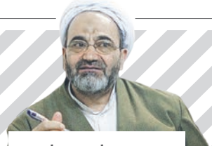
پدیده اربعین را دستکاری نکنیم