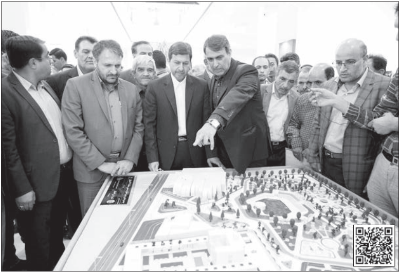
پارک را اسکن کنید

قطار افتتاح پروژه های شهری اصفهان به ایستگاه سی و هشتم رسید و این بار منطقه ۱۲ برای چهارمین بار (از ابتدای سال تاکنون) شاهد دو بهره برداری و یک کلنگ زنی پروژه بود. بهره برداری از بوستان جنب گلزار شهدای عاشق آباد و ساختمان جدید اداری شهرداری منطقه ۱۲ در کنار کلنگ زنی آغاز عملیات اجرایی پروژه بزرگ بوستان جنگلی در محله مهدیه، سه پروژه ای بودند که روز گذشته با حضور شهردار، مدیران شهری و اعضای شورای اسلامی شهر اصفهان و مردم منطقه اجرایی شد. به گفته شهردار اصفهان، رویکرد شهرداری اصفهان همان توزیع عادلانه خدمات و امکانات است و در مناطق کمتر برخوردار، شاهد افتتاح پروژه های بیشتری نسبت به هسته مرکزی و جنوبی شهر هستیم. دکتر مهدی جمالی نژاد خاطرنشان کرد: تصمیم و اراده مدیریت شهری این است که در مناطق کمتر برخوردار، محرك های توسعه را ایجاد کند و توزیع عادلانه خدمات و امکانات را داشته باشد.