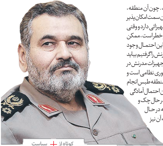
کوتاه + سیاست

رییس سابق ستاد کل نیروهای مسلح تشریح کرد؛