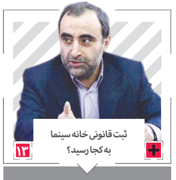
ثبت قانونی خانه سینما به کجا رسید؟