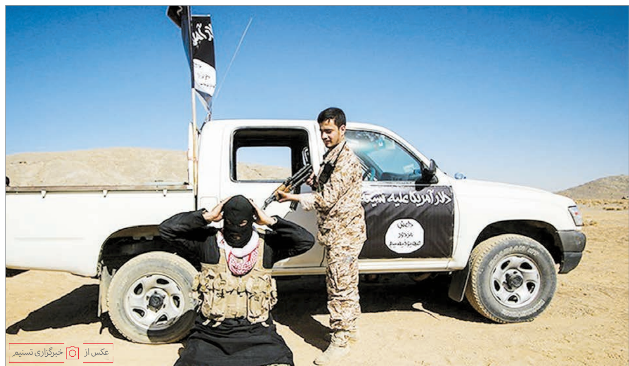
در قالب رزمایش «الی بیت المقدس» صورت گرفت؛ تمرین نبرد با داعش در اصفهان