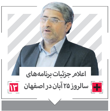
اعلام جزئیات برنامه‌های سالروز ۲۵ آبان در اصفهان