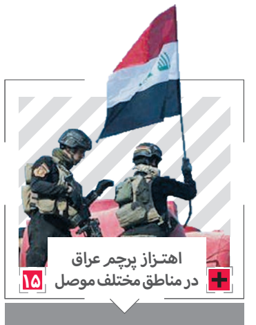
اهتزاز پرچم عراق در مناطق مختلف موصل