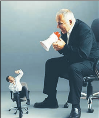
سید + سلامتی

قبل از مشخص شدن پاسخ این پرسش به کاهش یا