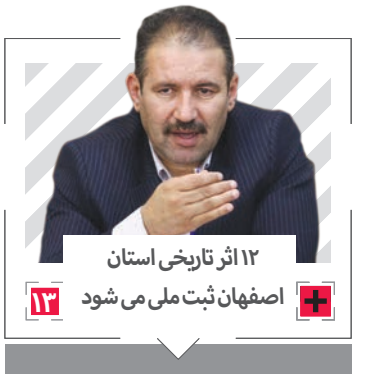
۱۲ اثر تاریخی استان اصفهان ثبت ملی می شود